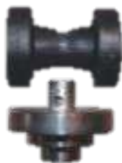
Plomada escalonada grande