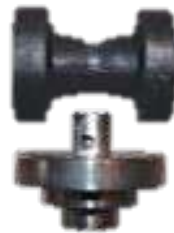
Plomada escalonada Pequeña